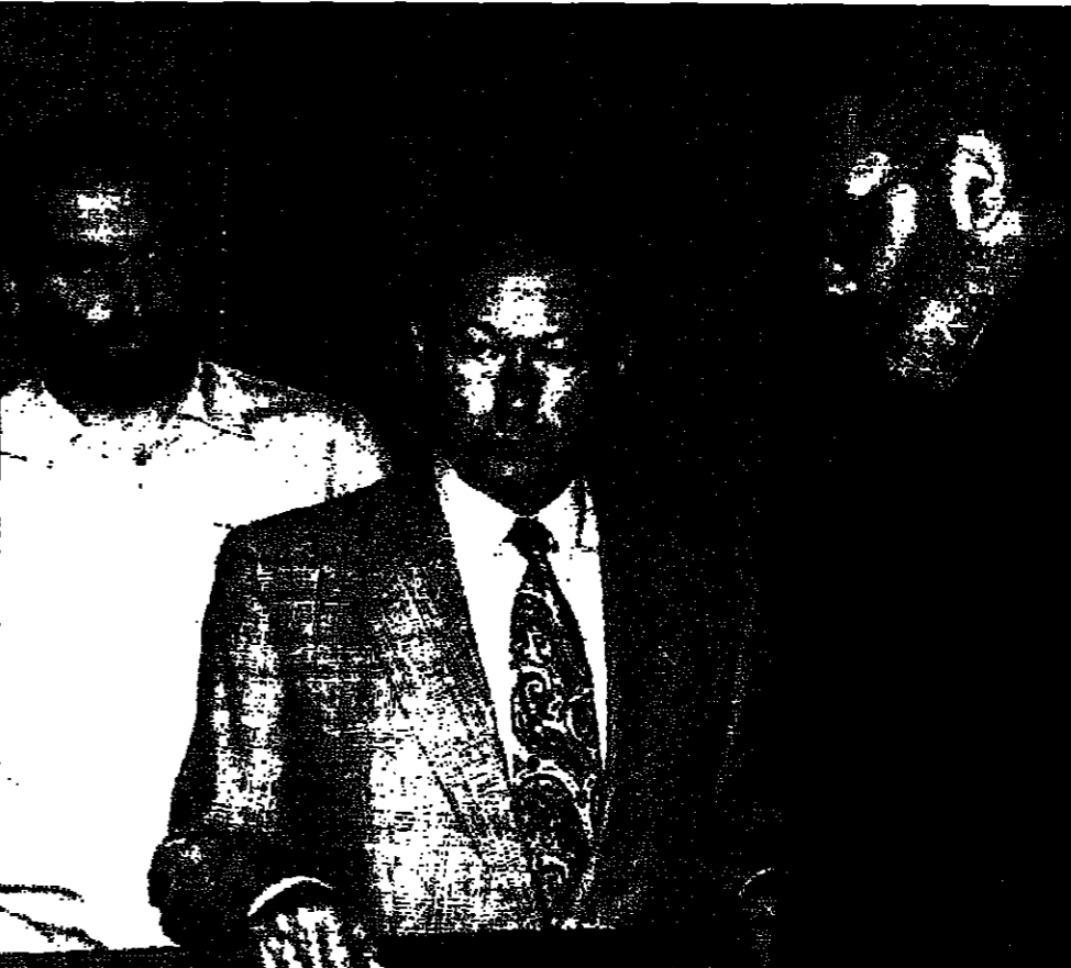
المتمم المائتان اثنا عشر الحاكم أمس (ديتار)